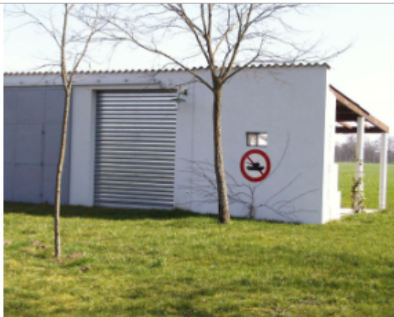
Vue du site BDHE 6086 point de repère 6217