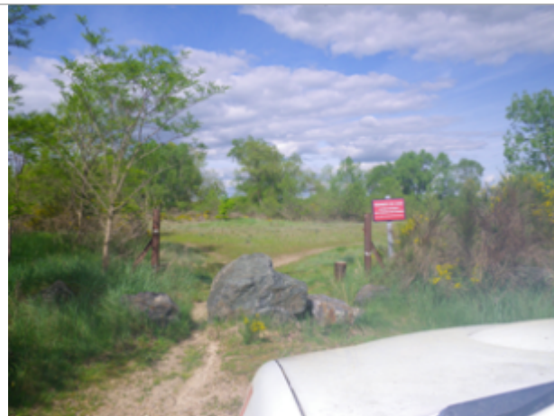
Vue du site BDHE 6084 point de repère 6216