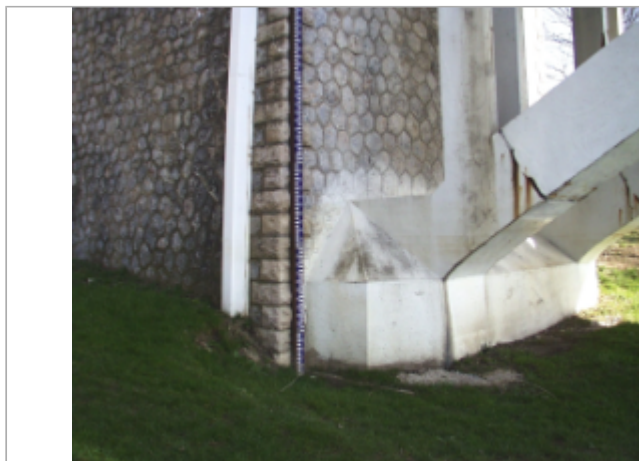
Vue du site BDHE 6081 point de repère 6086