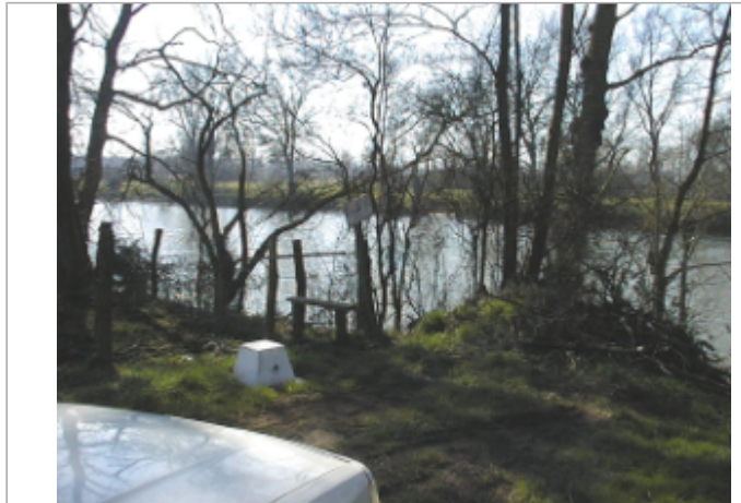
Vue du site BDHE 6074 point de repère 6208

Coordonnées WGS84 : X: 3.73611438 / Y: 46.54502308