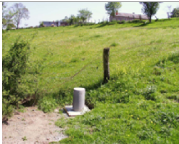
Vue du site BDHE 6059 point de repère 6258