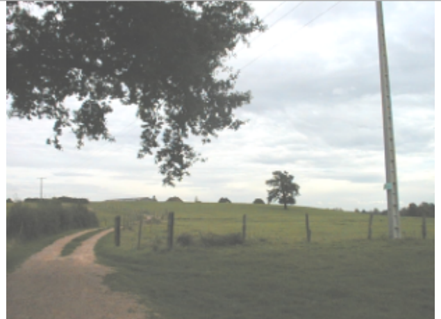
Vue du site BDHE 6033 point de repère 6189