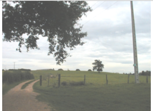
Vue du site BDHE 6033 point de repère 6189

Coordonnées WGS84 : X: 4.01728550 / Y: 46.31282751