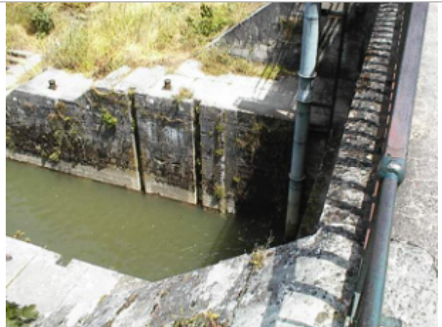
Vue du site BDHE 6140 point de repère 6242

Coordonnées WGS84 : X: 3.16586883 / Y: 46.98192021