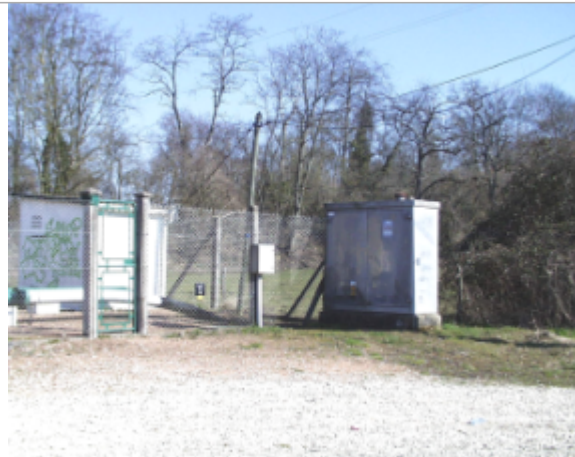
Vue du site BDHE 6138 point de repère 6239

Coordonnées WGS84 : X: 3.20556625 / Y: 46.97316795