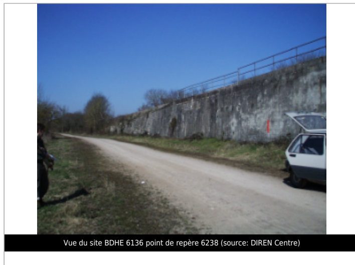
Vue du site BDHE 6136 point de repère 6238