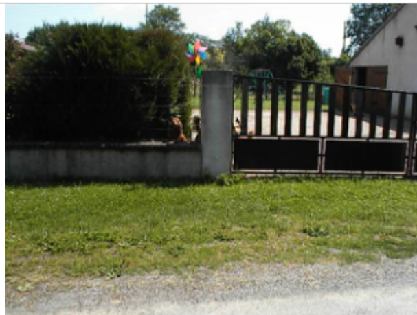
Vue du site BDHE 6130 point de repère 6253