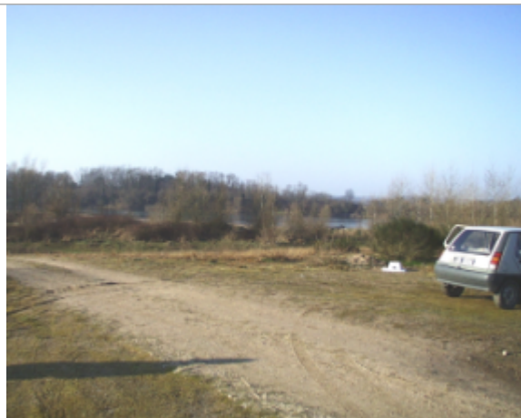
Vue du site BDHE 6117 point de repère 6231

Coordonnées WGS84 : X: 3.34051121 / Y: 46.84377111