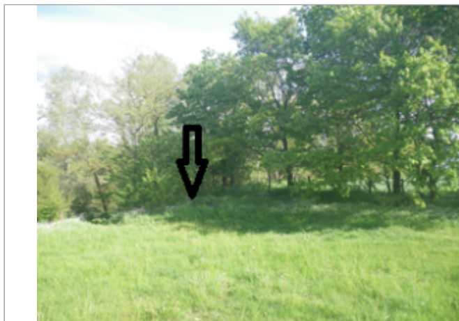
Vue du site BDHE 6091 point de repère 6218

Coordonnées WGS84 : X: 3.63196377 / Y: 46.71334660 Coordonnées RGF93 (Lambert 93) X: 748275 / Y: 6623887 Coordonnées RGF93 (ETRS89) : X: 3.6319638 / Y: 46.7133466 Code Hydro: ----0000 Rive de référence: Gauche