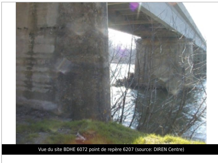
Vue du site BDHE 6072 point de repère 6207