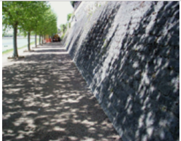
Vue du site BDHE 6046 point de repère 6051

Coordonnées WGS84 : X: 3.98618291 / Y: 46.43522276