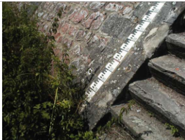
Vue du site BDHE 6005 point de repère 6008