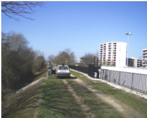
Vue du site BDHE 6312 point de repère 6261.