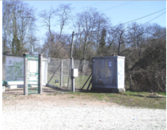
Vue du site BDHE 6138 point de repère 6239