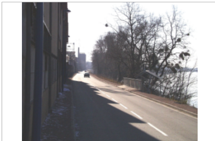
Vue du site BDHE 6132 point de repère 6236