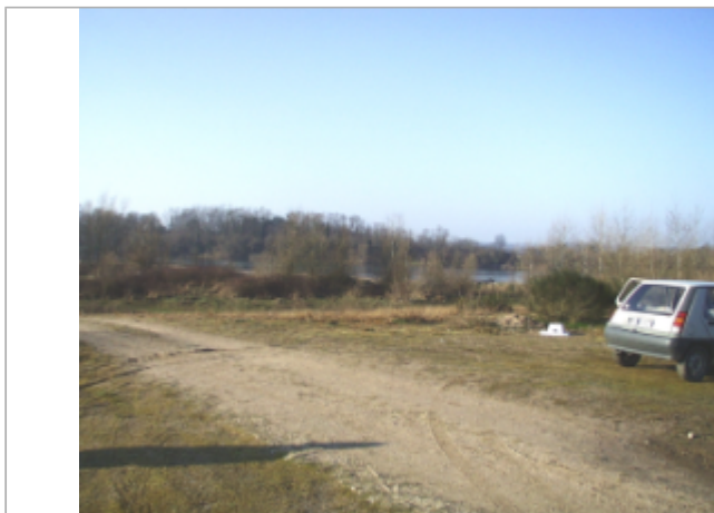
Vue du site BDHE 6117 point de repère 6231