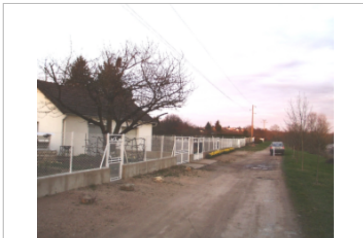
Vue du site BDHE 6112 point de repère 6229