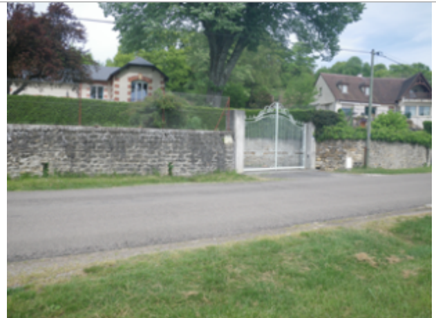
Vue du site BDHE 6149 point de repère 6246

Coordonnées WGS84 : X: 3.08579624 / Y: 46.96150662