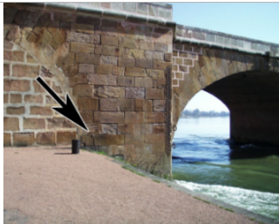
Vue du site BDHE 6142 point de repère 6156