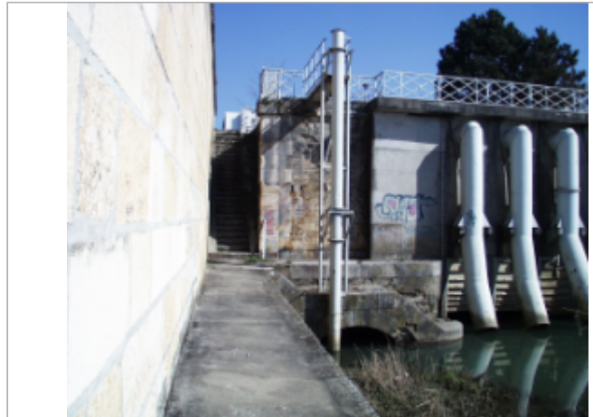
Vue du site BDHE 6141 point de repère 6155

Coordonnées WGS84 : X: 3.15922165 / Y: 46.98520684