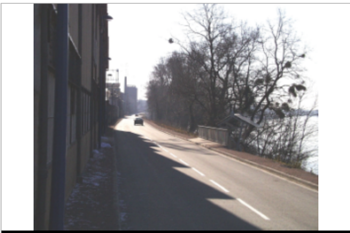
Vue du site BDHE 6132 point de repère 6236

GÉOLOCALISATION Coordonnées WGS84 : X: 3.25474134 / Y: 46.93544393 Coordonnées RGF93 (Lambert 93) X: 719380 / Y: 6648392 Coordonnées RGF93 (ETRS89) : X: 3.2547413 / Y: 46.9354439 Code Hydro: ----0000 Rive de référence: Droite