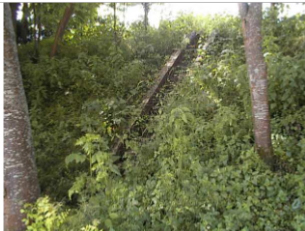
Vue du site BDHE 6105 point de repère 6118