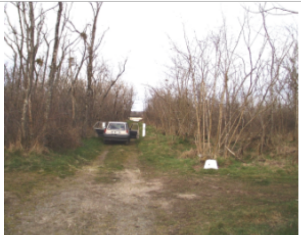
Vue du site BDHE 6099 point de repère 6226

Coordonnées WGS84 : X: 3.57127002 / Y: 46.77402936