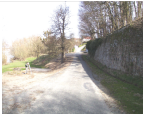
Vue du site BDHE 6075 point de repère 6209

Coordonnées WGS84 : X: 3.74397255 / Y: 46.56616058