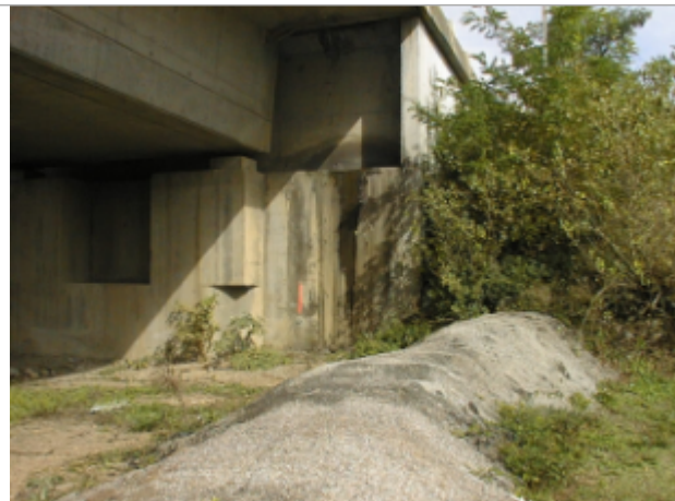
Vue du site BDHE 6011 point de repère 6179

Coordonnées WGS84 : X: 4.09543182 / Y: 46.07074126