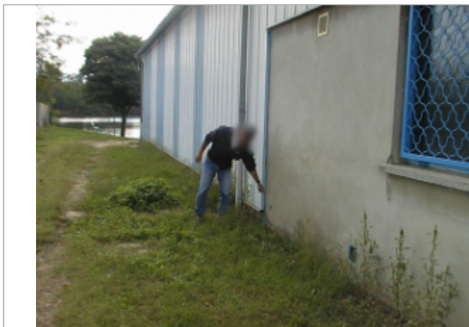
Vue du site BDHE 6004 point de repère 6173