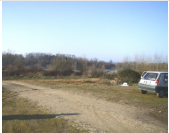
Vue du site BDHE 6117 point de repère 6231

Coordonnées WGS84 : X: 3.34051121 / Y: 46.84377111