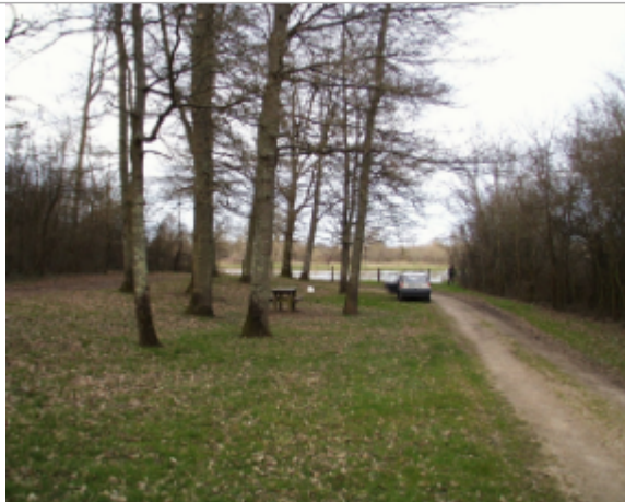
Vue du site BDHE 6097 point de repère 6225

Coordonnées WGS84 : X: 3.59897133 / Y: 46.74871241