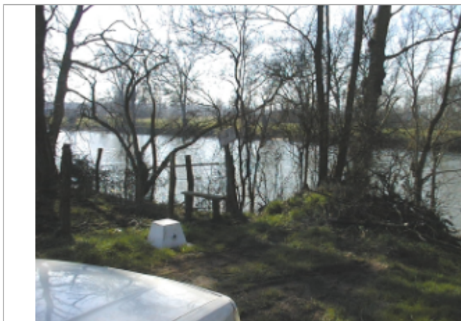
Vue du site BDHE 6074 point de repère 6208