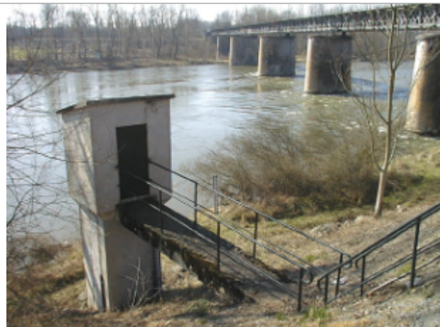
Vue du site BDHE 6071 point de repère 6076