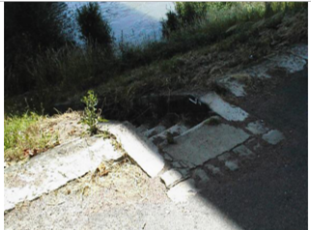
Vue du site BDHE 6143 point de repère 6157

Coordonnées WGS84 : X: 3.15247998 / Y: 46.98327120