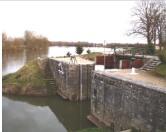
Vue du site BDHE 6107 point de repère 6120