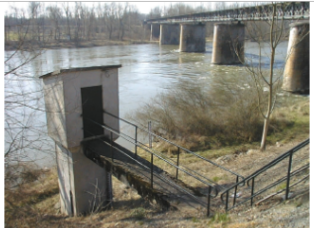
Vue du site BDHE 6071 point de repère 6076

Coordonnées WGS84 : X: 3.76595016 / Y: 46.53862293