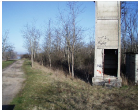
Vue du site BDHE 6121 point de repère 6232