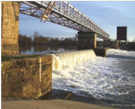
Vue du site BDHE 6111 point de repère 6125