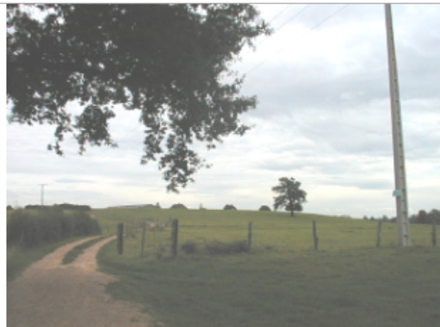
Vue du site BDHE 6033 point de repère 6189