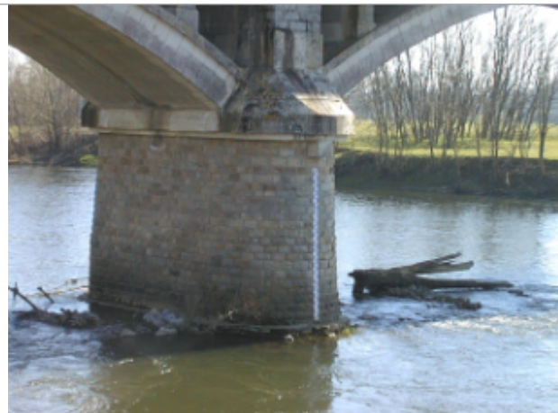
Vue du site BDHE 6022 point de repère 6027