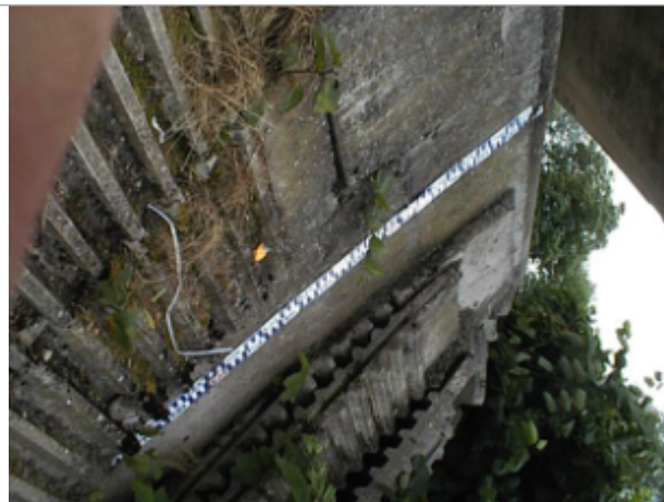
Vue du site BDHE 6017 point de repère 6020