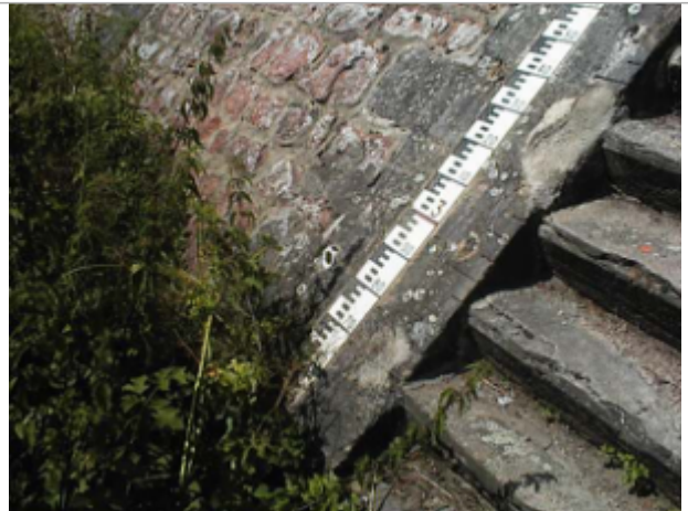
Vue du site BDHE 6005 point de repère 6008

Coordonnées WGS84 : X: 4.08014314 / Y: 46.03282054