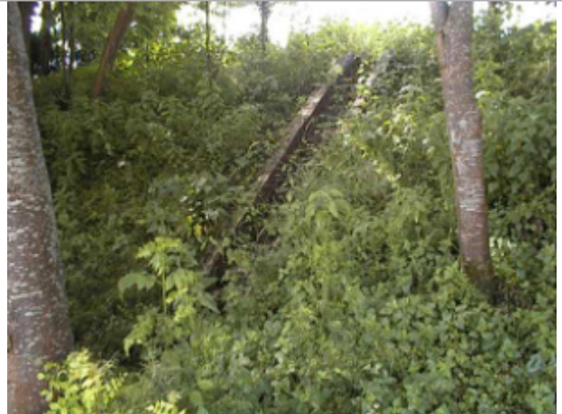
Vue du site BDHE 6105 point de repère 6118

Coordonnées WGS84 : X: 3.48471282 / Y: 46.81137084