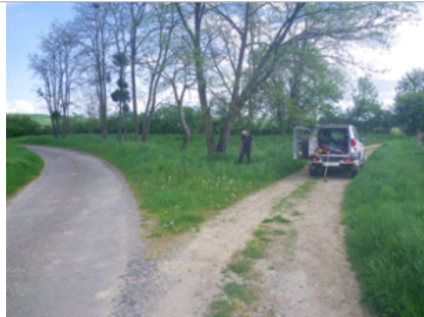
Vue du site BDHE 6065 point de repère 6203