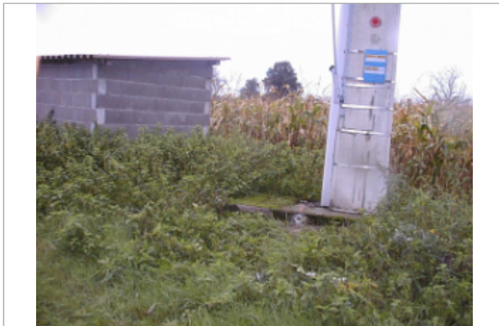
Vue du site BDHE 6062 point de repère 6201