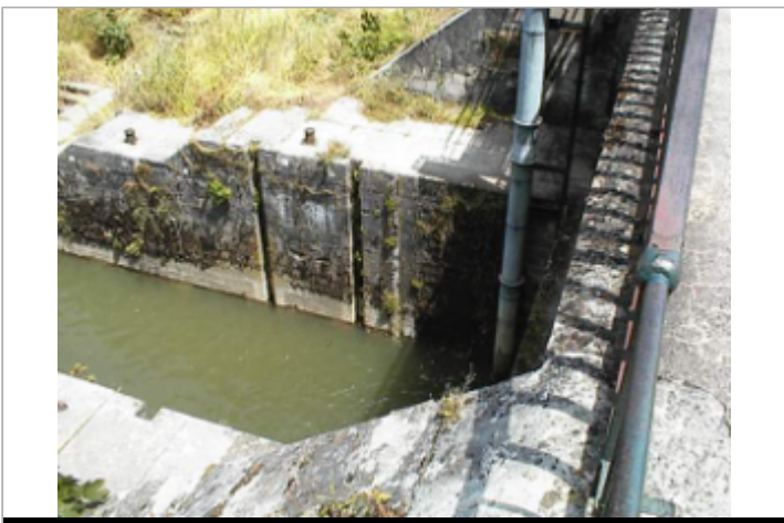
Vue du site BDHE 6140 point de repère 6242

GÉOLOCALISATION Coordonnées WGS84 : X: 3.16586883 / Y: 46.98192021 Coordonnées RGF93 (Lambert 93) X: 712608 / Y: 6653536 Coordonnées RGF93 (ETRS89) : X: 3.1658688 / Y: 46.9819202 Code Hydro: ----0000 Rive de référence: Gauche