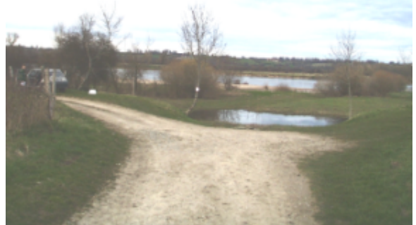
Vue du site BDHE 6103 point de repère 6227

Coordonnées WGS84 : X: 3.52625369 / Y: 46.79313502