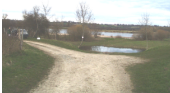
Vue du site BDHE 6103 point de repère 6227