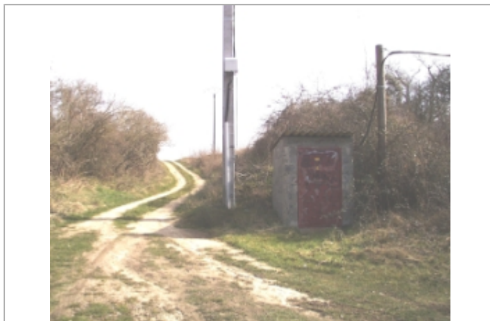
Vue du site BDHE 6077 point de repère 6210