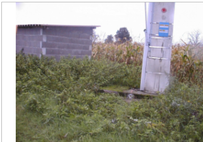
Vue du site BDHE 6062 point de repère 6201

Coordonnées WGS84 : X: 3.85982168 / Y: 46.50099952