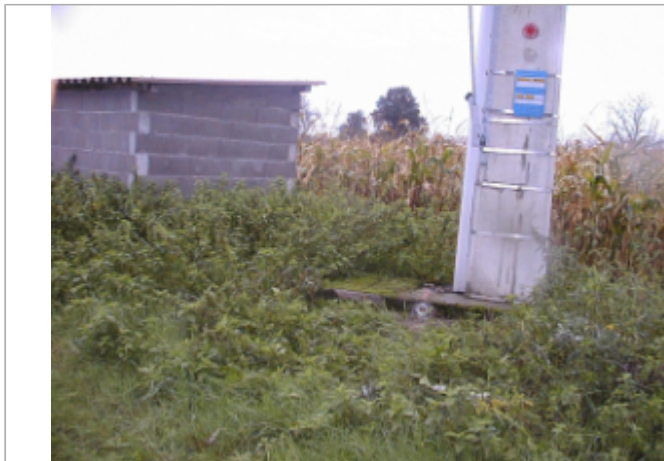
Vue du site BDHE 6062 point de repère 6201