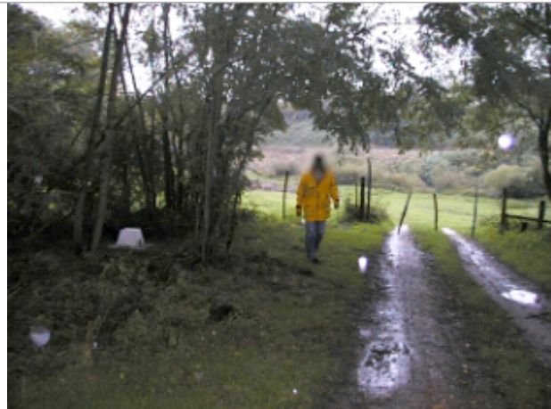
Vue du site BDHE 6057 point de repère 6198

Coordonnées WGS84 : X: 3.91933570 / Y: 46.49538559